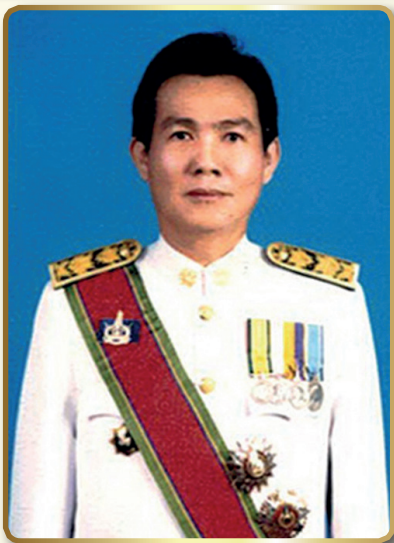
นายนิวัฒน์ รุ่งสาคร รองอธิบดีกรมการปกครอง

รับตำแหน่งเมื่อวันที่ 22 พฤศจิกายน 2560 การศึกษา