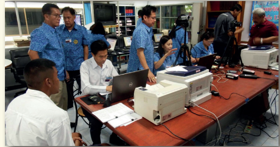
สถิติการออกหน่วยบริการจัดทำบัตรประจำตัวประชาชนเคลื่อนที่ (Mobile Unit) ตั้งแต่วันที่ 1 ตุลาคม - 30 พฤศจิกายน 2560