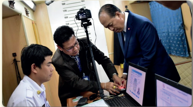
พลเอก อนุพงษ์ เผ่าจินดา รัฐมนตรีว่าการกระทรวงมหาดไทย เยี่ยมชมหน่วยบริการเคลื่อนที่ (Mobile Unit) ของกรมการปกครอง และจัดทำบัตรประจำตัวประชาชน ณ จุดบริการศาลาว่าการกระทรวงมหาดไทย เมื่อวันที่ 10 พฤศจิกายน 2560