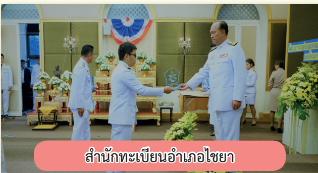
สำนักทะเบียนอำเภอไชยา

ชนะเลิศอันดับที่ 3 ประเภทสำนักทะเบียนอำเภอ จำนวนราษฎร ไม่เกิน 50,000 คน ได้แก่ สำนักทะเบียนอำเภอนิคมน้ำอ้อย จ.มุกดาหาร