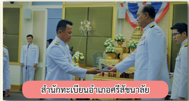
สำนักทะเบียนอำเภอศรีสัชชาลัย

ชนะเลิศอันดับที่ 2 ประเภทสำนักทะเบียนอำเภอ จำนวนราษฎร ตั้งแต่ 50,000 – 80,000 คน ได้แก่ สำนักทะเบียนอำเภอไชยา จ.สุราษฎร์ธานี