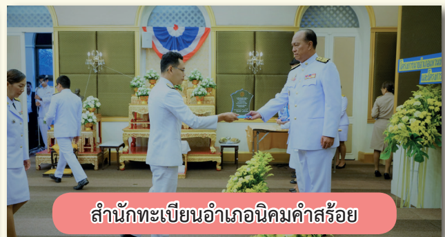
สำนักทะเบียนอำเภอนิคมน้ำอ้อย