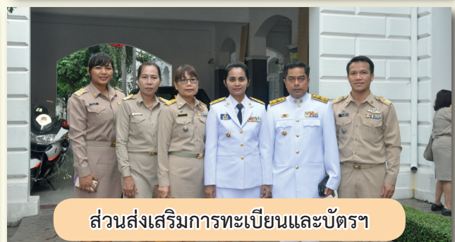
ส่วนส่งเสริมการทะเบียนและบัตรฯ