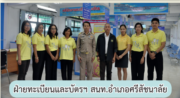
ฝ่ายทะเบียนและบัตรฯ สนท.อำเภอศรีสัชชาลัย