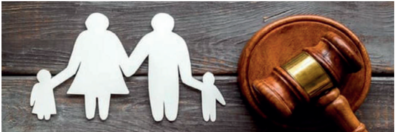
อ้างอิงจากหนังสือกรมการปกครอง ที่ มท 0309.3/ว 20778 ลงวันที่ 27 สิงหาคม 2564

ยินยอมให้บุตรเดินทางไปต่างประเทศกับบิดาที่มีชอบด้วยกฎหมาย หรือบุคคลอื่นได้ ดังนั้น เจ้าหน้าที่ผู้รับผิดชอบจึงต้องใช้ความ ระมัดระวังในการดำเนินการ เพื่อป้องกันและปราบปรามการทุจริต กรณีการอุ้มบุญที่ผิดกฎหมายให้บันทึกถ้อยคำการสอบสวน (ปค.14) ผู้ใช้อำนาจปกครองบุตร ผู้ที่เด็กจะเดินทางไปต่างประเทศด้วย (ถ้ามี) และพยานบุคคลที่น่าเชื่อถือยืนยันในประเด็นที่เกี่ยวกับความเป็นบิดา ของบุตรหรือความสัมพันธ์ของผู้เยาว์กับบุคคลอื่น และความสัมพันธ์ ทางด้านครอบครัว เช่น การอุปการะเลี้ยงดู เป็นต้น ซึ่งผู้ให้ถ้อยคำต้อง ยืนยันด้วยว่าตนเองมิได้มีเจตนาทุจริตหรือผลประโยชน์อื่นใดแอบแฝง ในการยินยอมให้บุตรเดินทางไปต่างประเทศกับบิดาที่มีชอบด้วย กฎหมายหรือบุคคลอื่น เพื่อให้เกิดความรั้งผิดทางอาญา ทั้งนี้ ต้องแจ้ง บุคคลดังกล่าวทราบว่าการให้ถ้อยคำดังกล่าวเป็นการให้ถ้อยคำต่อ เจ้าพนักงานที่กระทำตามหน้าที่ การให้ถ้อยคำอันเป็นเท็จย่อมมี ความผิดฐานแจ้งความเท็จต่อเจ้าพนักงานตามประมวลกฎหมาย อาญามาตรา 137 หรือมาตรา 267 และให้สำเนาบันทึกถ้อยคำ การสอบสวน (ปค.14) ที่ได้รับรองแล้ว ส่งมอบให้ผู้ยื่นคำร้องพร้อมกับ หนังสือให้ความยินยอมเพื่อใช้ประกอบเป็นหลักฐานในการรับรอง นิติกรรมกับกรมการกงสุลต่อไป