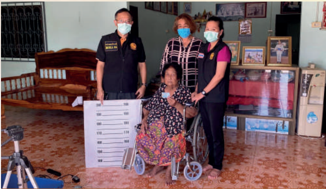
สาขาจังหวัดชุมพร

ศูนย์บริหารการทะเบียนภาค 8 สาขาจังหวัด ชุมพร กระบี่ พังงา ระนอง นครศรีธรรมราช และสุราษฎร์ธานี ร่วมกับสำนักทะเบียนอำเภอในพื้นที่ออกให้บริการจัดทำบัตรประจำตัวประชาชน กรณีผู้ป่วยติดเตียง คนชรา ผู้พิการ จนไม่สามารถเคลื่อนย้ายได้ ประจำเดือน กันยายน 2564 จำนวน 14 ราย