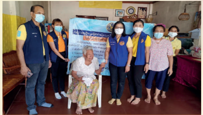
สาขาจังหวัดกระบี่