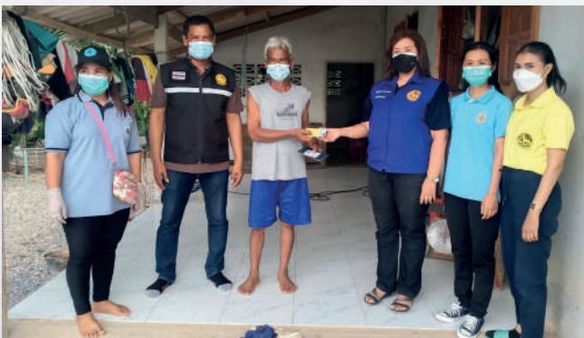
สาขาจังหวัดนครศรีธรรมราช