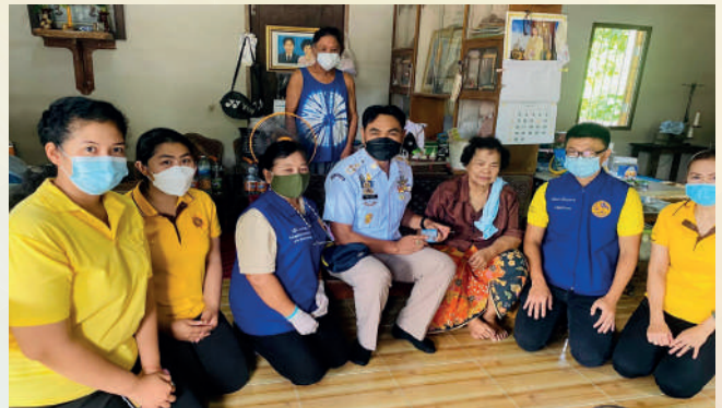
สาขาจังหวัดระนอง