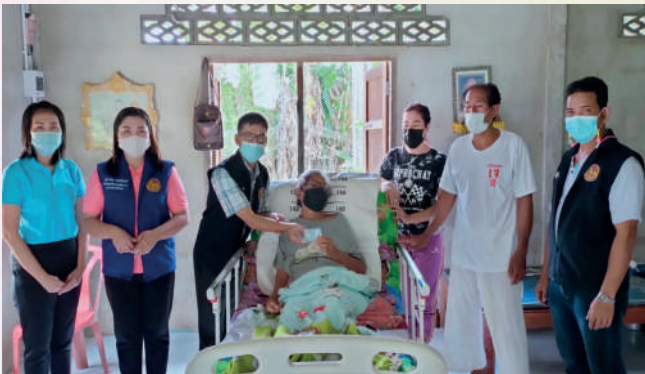
สาขาจังหวัดพังงา