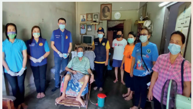
สาขาจังหวัดสุราษฎร์ธานี

“ แม้ความดีจะเป็นได้แค่รูปธรรมและนามธรรม แต่ความดีเป็นน้ำหล่อเลี้ยงที่เราสามารถหยิบยื่นให้กันและกันได้ ”