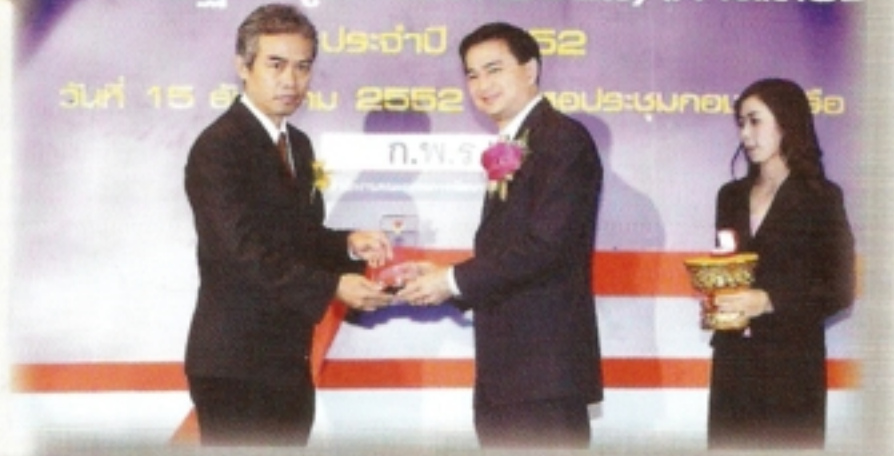
รางวัลคุณภาพการให้บริการประชาชน ประเภทรางวัลดีเด่น ประจำปี 2552