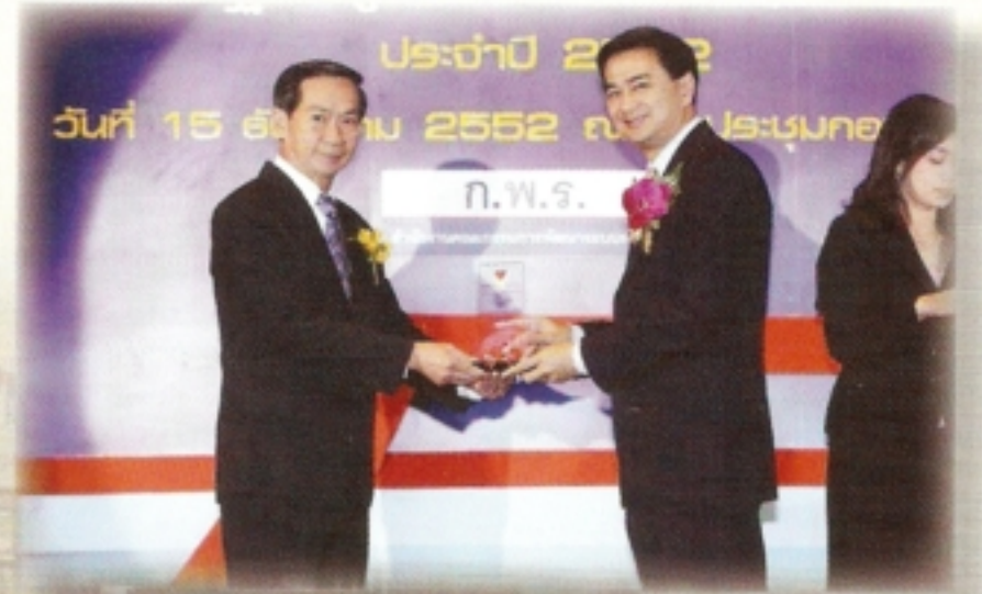
รางวัลคุณภาพการให้บริการประชาชน ประเภทรางวัลดีเด่น ประจำปี 2552