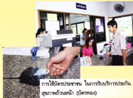
การใช้บัตรประชาชน ในการรับบริการประกันสุขภาพถ้วนหน้า (บัตรทอง)

นอกจากประโยชน์ที่กล่าวมาทั้งหมดแล้ว ปัจจุบัน สำนักงานคณะกรรมการการเลือกตั้งได้ร่วมกับจุฬาลงกรณ์มหาวิทยาลัย จัดทำโครงการศึกษาวิจัยและพัฒนาการจัดทำ บัญชีรายชื่อผู้มีสิทธิเลือกตั้งและระบบการลงทะเบียนผู้มีสิทธิเลือกตั้ง โดยใช้บัตร Smart Card เป็นข้อกำหนดของระบบงาน ในการลงทะเบียนผู้มีสิทธิเลือกตั้งซึ่งหากโครงการนี้ดำเนินการแล้วเสร็จ จะเป็นประโยชน์อย่างยิ่งต่อการพัฒนาระบบการเลือกตั้งของประเทศไทย