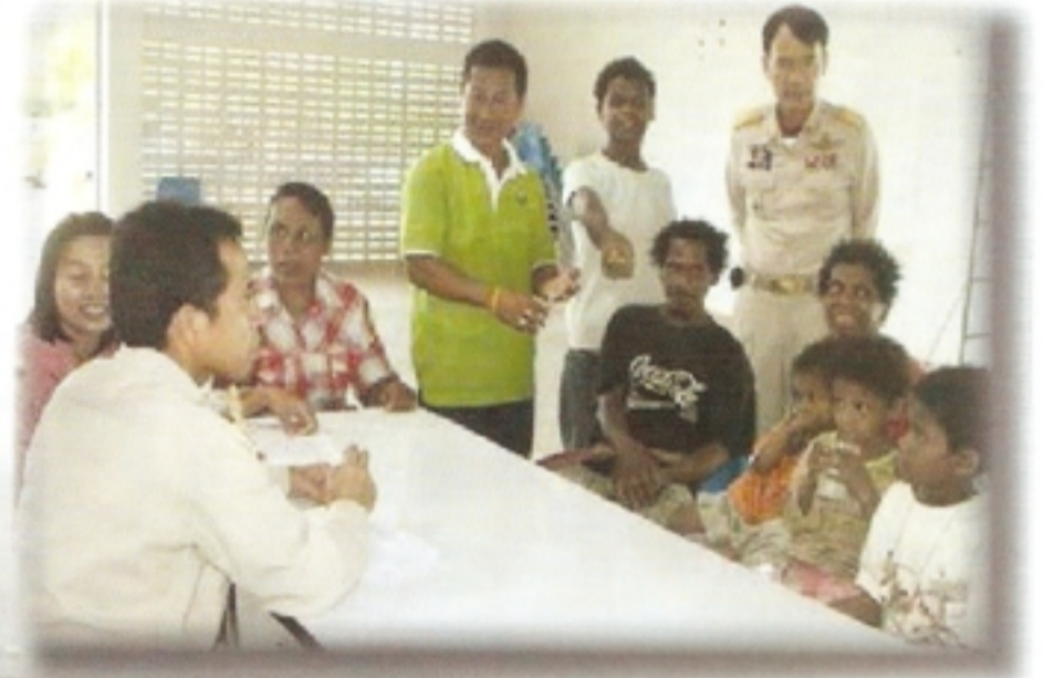
สถานะและสิทธิของบุคคลตามมติคณะรัฐมนตรีเมื่อวันที่ 18 มกราคม 2548 สภาพปัญหา

ในอดีตรัฐบาลได้เร่งรัดที่จะแก้ปัญหาเพื่อให้สถานะแก่บุคคลต่างด้าวเข้าเมืองโดยชอบด้วยกฎหมายแก่ผู้อพยพเข้ามาและให้แปลงสัญชาติไทยแก่ผู้ที่มีเชื้อสายไทย โดยบุตรที่เกิดในประเทศไทยจะได้รับสัญชาติไทย นอกจากนี้รัฐบาลยังได้กำหนดสถานะและพิจารณาให้สถานะให้แก่ชนกลุ่มน้อยที่อาศัยอยู่ในประเทศไทยจำนวน 3 กลุ่มเป้าหมาย คือ 1. กลุ่มเป้าหมายที่เป็นชนกลุ่มน้อยอาศัยอยู่ในประเทศไทยอย่างถาวร จำนวน 14 กลุ่ม ได้แก่ 1) บุคคลบนพื้นที่สูงและชุมชนบนพื้นที่สูง 2) เวียดนามอพยพ 3) ลาวอพยพ 4) ผู้พลัดถิ่นสัญชาติพม่า 5) ชาวเขาที่อพยพเข้ามาเมื่อวันที่ 3 ตุลาคม 2528 6) ผู้พลัดถิ่นสัญชาติพม่าเชื้อสายไทย 7) จีนฮ่ออิสระ 8) อดีตทหารจีนคณะชาติและจีนอพยพ 9) อดีตโจรจีนคอมมิวนิสต์มลายา 10) ไทยลื้อ 11) เนปาลอพยพ 12) ผู้อพยพเชื้อสายไทยจากจังหวัดเกาะกงและผู้หลบหนีเข้าเมืองจากกัมพูชา 13) ม้งในที่พักสงฆ์ถ้ำกระบอก 14) เผ่ามอร์แกน 2. กลุ่มเป้าหมายที่รัฐบาลผ่อนผันให้อยู่ชั่วคราวและได้จัดทำทะเบียนประวัติประจำตัวไว้แล้ว และ 3. กลุ่มเป้าหมายตามยุทธศาสตร์การจัดการปัญหา