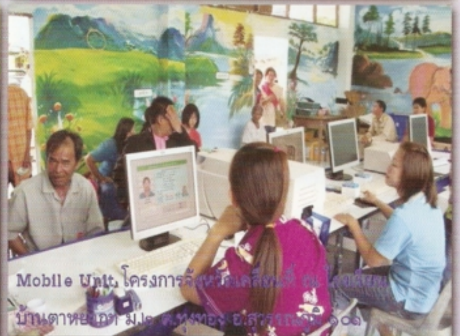
Mobile Unit โครงการลิ่งห้วยเคลื่อนที่ ณ โรงเรียน บ้านตาหยง ม.๑๒ ต.หนอง อ.สวางคบุรี จ.อุทัยธานี