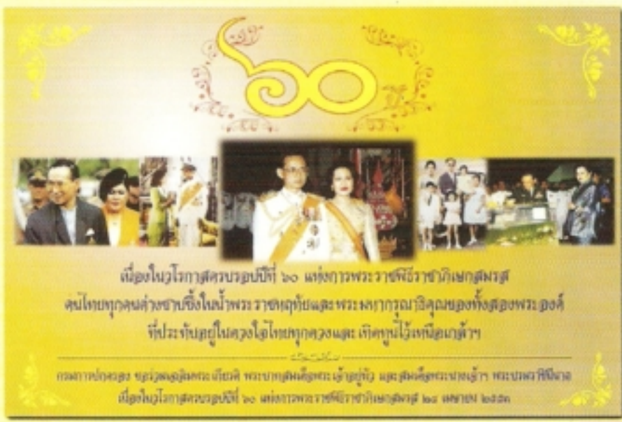
เนื่องในวโรกาสครบรอบปีที่ ๖๐ แห่งการพระราชพิธีราชาภิเษกสมรส คนไทยทุกคนต่างซาบซึ้งในน้ำพระราชมารยาทและพระมหากรุณาธิคุณของทั้งสองพระองค์ ที่ประทับอยู่ในดวงใจไทยทุกคนและเทิดทูนไว้เหนือเกล้าฯ กรมการปกครอง กระทรวงมหาดไทย เนื่องในวโรกาสครบรอบปีที่ ๖๐ แห่งการพระราชพิธีราชาภิเษกสมรส ๒๘ เมษายน ๒๕๕๓

และในวโรกาสมหามงคลครบรอบปีที่ 60 แห่งการพระราชพิธีราชาภิเษกสมรส สำนักบริหารการทะเบียน จึงได้จัดทำป้ายประชาสัมพันธ์ “เฉลิมพระเกียรติครบรอบ ปีที่ 60 แห่งการพระราชพิธีราชาภิเษกสมรส” เพื่อมอบให้กับสำนักทะเบียนจังหวัดและสำนักทะเบียนอำเภอได้นำไปเผยแพร่ ณ สำนักทะเบียนทุกแห่งอีกด้วย