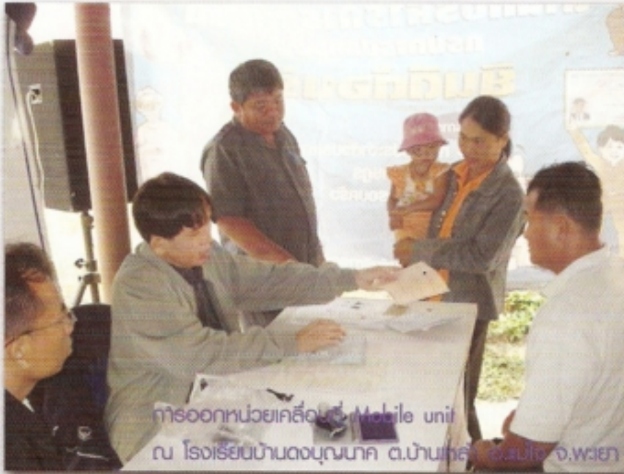
การออกหน่วยเคลื่อนที่ Mobile unit ณ โรงเรียนบ้านดงขุนนาค ต.บ้านกล้วย อ.เมือง จ.พเยา