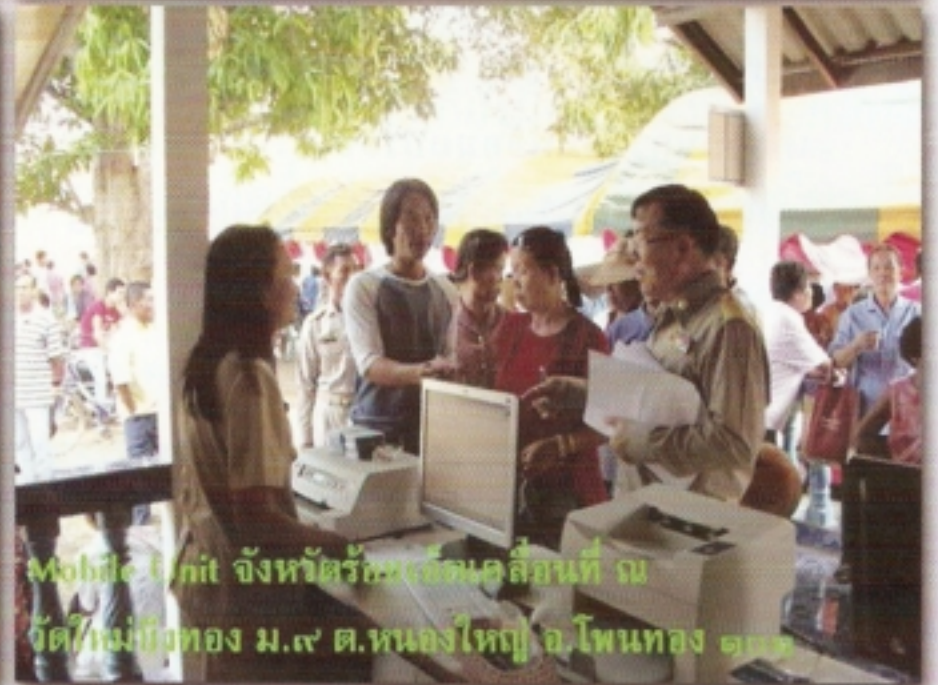
Mobile Unit จังหวัดราชบุรีเคลื่อนที่ ณ จัดกิจกรรมท้อง ม.๙ ต.หนองใหญ่ อ.โพธารอง จ.ราชบุรี