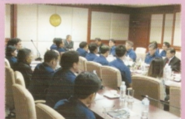
อปค. ประชุมและมอบนโยบาย