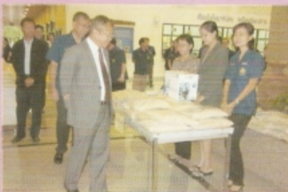
อปค. เยี่ยมชมการขายสินค้าราคาถูก