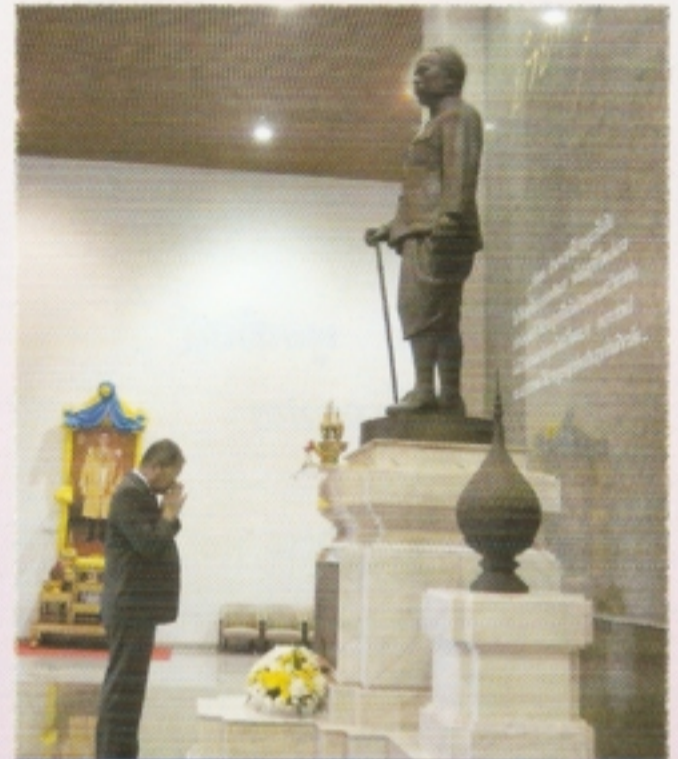
อธิบดีกรมการปกครองสักการะ พระอนุสาวรีย์กรมพระยาดำรงราชานุภาพ

ดังนั้นสิ่งที่เราจะต้องเริ่มต้นทำในวันนี้ ทุกคนต้อง เริ่มต้นจากครอบครัว จากหน่วยงาน ที่จะต้องใช้แนวคิดของ ความคิดหลากหลายดอกไม้หลากสี เอาทฤษฎีดอกไม้ หลากสีไปปฏิบัติให้ดี และมันก็จะทำให้สังคมอยู่ได้ด้วย ความสุข พัฒนาไปได้อย่างยั่งยืนต่อไป”