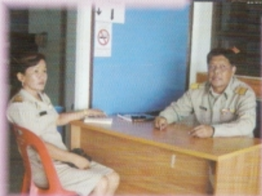
กำนัน ผู้ใหญ่บ้าน ปฏิบัติหน้าที่บริการ ประชาชน ณ สำนักทะเบียน