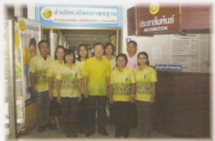
ทีมงานบริการประชาชน ของ สำนักทะเบียนอำเภอปรางค์ชัย