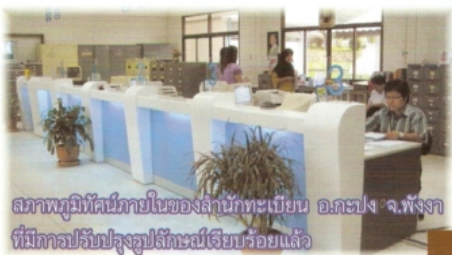
สภาพภูมิทัศน์ภายในของสำนักทะเบียน อ.กะปง จ.พังงา ที่มีการปรับรูปลักษณ์เรียบร้อยแล้ว

ผลจากการนิเทศงาน และติดตามผลการดำเนินงานของสำนักทะเบียนต่างๆ ตามโครงการนิเทศงานการทะเบียนและบัตรประจำตัวประชาชน พ.ศ.2553 ปรากฏว่ามีสำนักทะเบียนอำเภอหลายแห่ง ได้มีความมุ่งมั่นตั้งใจที่จะทำให้ประชาชนซึ่งเข้ามาใช้บริการ ณ สำนักทะเบียนอำเภอ เกิดความรู้สึกที่ดีต่อสภาพภูมิทัศน์ภายในสำนักทะเบียน ซึ่งเปรียบเสมือนห้องรับแขกของที่ว่าอำเภอที่ทีมงานนิเทศฯ จึงได้นำภาพการพัฒนาสถานที่ให้บริการของสำนักทะเบียนที่ได้มีการปรับรูปลักษณ์ (Look) แล้ว และสามารถเป็นแบบอย่างที่ดี (Best Practice) มานำเสนอเพื่อเป็นกรณีตัวอย่างให้แก่สำนักทะเบียนต่างๆ ได้เปิดมุมมองในการพัฒนาสถานที่ให้บริการให้เหมาะสมกับปัจจัยทางกายภาพ และความพร้อมของแต่ละอำเภอ โดยมีแนวทางที่เป็นมาตรฐานเดียวกันต่อไป