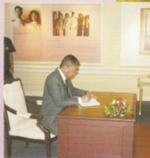
อปค. ลงนามถวายพระพร ณ ห้องนิทรรศการเฉลิมพระเกียรติ ชั้น 4 ส.บ.ท.