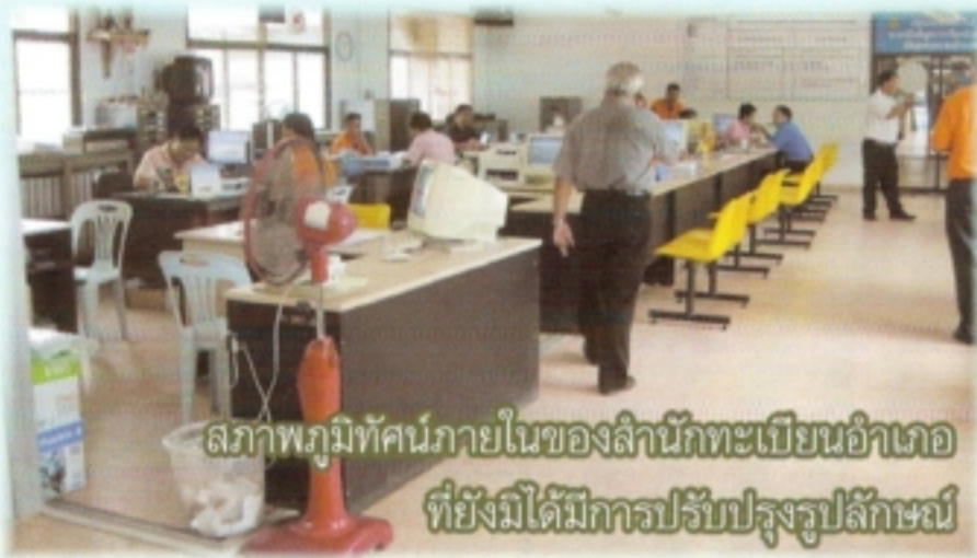
สภาพภูมิทัศน์ภายในของสำนักทะเบียนอำเภอที่ยังไม่ได้มีการปรับรูปลักษณ์

การพัฒนาคุณภาพของการให้บริการประชาชนด้านการทะเบียนและบัตรประจำตัวประชาชน เป็นนโยบายสำคัญของกรมการปกครอง ที่ได้มอบหมายให้สำนักบริหารการทะเบียน ได้ดำเนินการมาอย่างต่อเนื่อง โดยมีทิศทางตามประเด็นยุทธศาสตร์การพัฒนาราชการ ซึ่งประกอบด้วยยุทธศาสตร์การพัฒนากุศลกร การพัฒนากระบวนการให้บริการ และการพัฒนาสถานที่ให้บริการ โดยมีเป้าหมายอยู่ที่ประชาชนผู้มารับบริการ มีความพึงพอใจต่องานบริการของสำนักทะเบียนอำเภอทั่วประเทศ