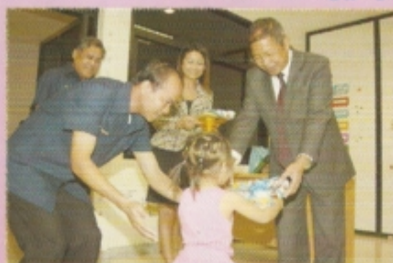
อปค. เยี่ยมชมศูนย์การเรียนรู้เพื่อพัฒนาและ ส่งเสริมคุณธรรมจริยธรรมแก่เด็กและเยาวชน