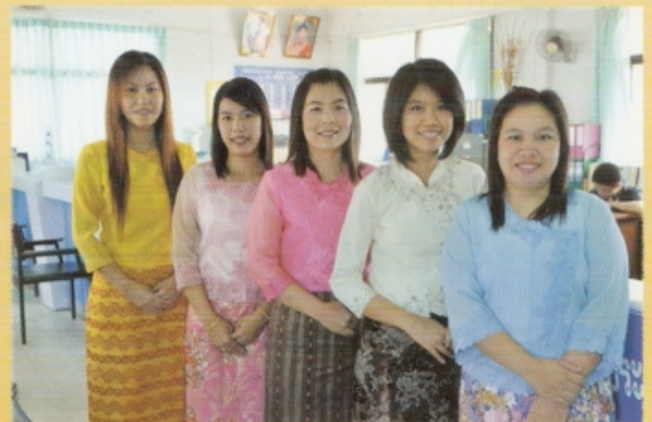
การแต่งกายด้วยชุดประจำถิ่น เพื่อสร้างบรรยากาศที่ดี ในการให้บริการ ของสำนักทะเบียนอำเภอแม่สอด