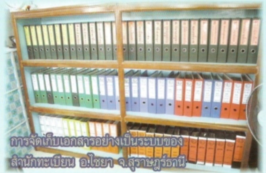
การจัดเก็บเอกสารอย่างเป็นระบบของสำนักทะเบียน อ.ไชยา จ.สุราษฎร์ธานี

ประเด็นการพัฒนาสถานที่ให้บริการที่จะต้องมีการติดตามและดำเนินการอย่างต่อเนื่อง คือ