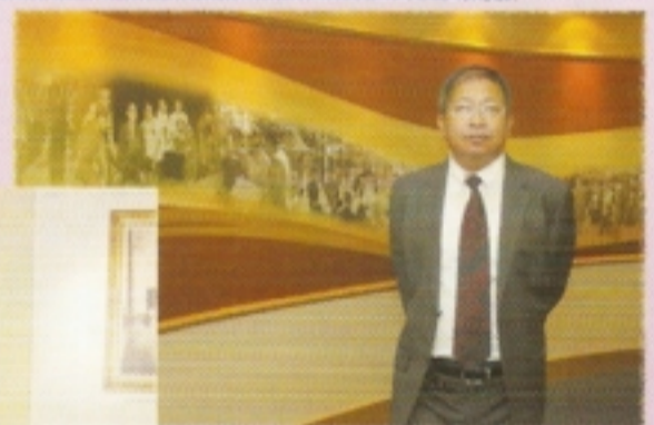
อปค. เยี่ยมชมห้อง นิทรรศการเฉลิมพระเกียรติ ชั้น 4 ส.บ.ท.