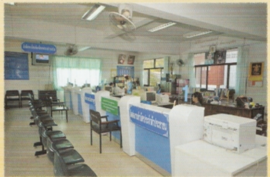
การจัดอุปกรณ์อำนวยความสะดวก ระหว่างรอรับบริการ ของสำนักทะเบียนอำเภอแม่สอด