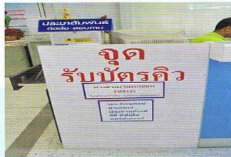
การปรับปรุงกระบวนการบริการประชาชน