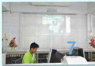
การประยุกต์ใช้เทคโนโลยีมาปรับปรุงการบริการ