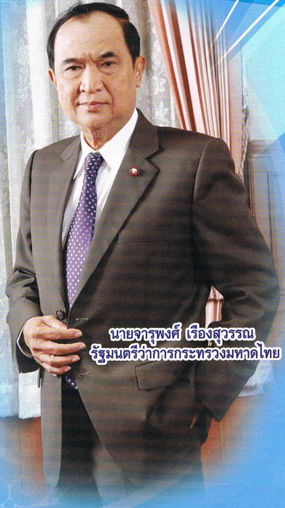
นายจอรุพงศ์ เรืองสุวรรณ รัฐมนตรีว่าการกระทรวงมหาดไทย