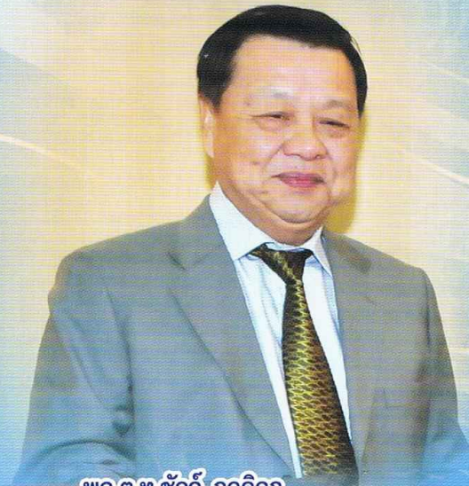
พล.ต.ท.ชัชจี้ กุลดิลก รัฐมนตรีช่วยว่าการกระทรวงมหาดไทย

THE ONE Call Center 1548 ปีที่ 4 ฉบับที่ 11 ประจำเดือนพฤศจิกายน 2555