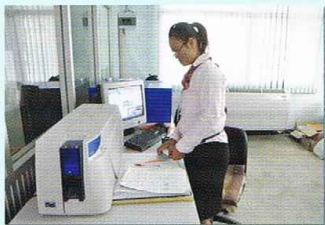
การจัดเก็บเอกสารสำคัญทางการทะเบียน