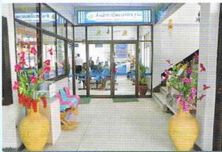
ปรับปรุงทัศน