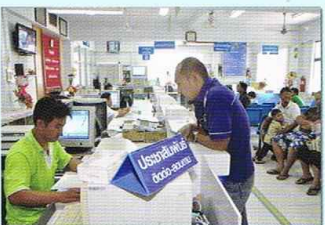
การจัดสำนักงาน