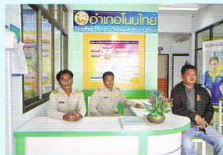
การประเมินความพึงพอใจของประชาชน