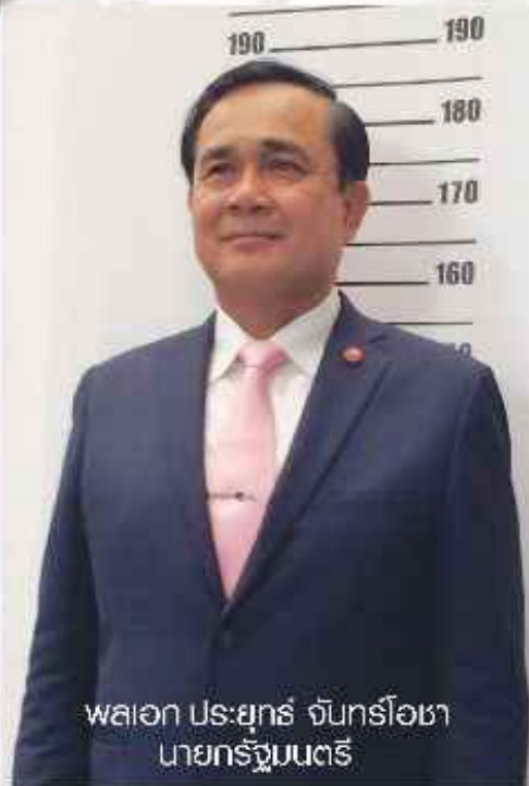
พลเอก ประยุทธ์ จันทร์โอชา นายกรัฐมนตรี

สำนักกะเม็งนอ้าเกอ/สำนักกะเม็งนท้อกกั้น “โม่รงโส นริการตัคจใจ เม็นธรรม”