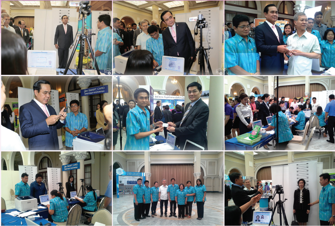
พลเอกประยุทธ์ จันทร์โอชา นายกรัฐมนตรี เป็นประธานการเปิดประชุมสัมมนาทางวิชาการ เรื่อง “ข้อมูลข่าวสารกับการปฏิรูปประเทศ” (Information Act and National reform) เมื่อวันที่ 13 กุมภาพันธ์ 2558 ณ ดิคสันติไมตรี ทำเนียบรัฐบาล โดยสำนักบริหารการทะเบียน ส่วนบัตรประจำตัวประชาชน ได้จัดหน่วยบริการจัดทำบัตรเคลื่อนที่ (Mobile Unit) เพื่อเข้าร่วมจัดนิทรรศการ และให้บริการจัดทำบัตรประจำตัวประชาชนแบบอเนกประสงค์ (Smart Card)