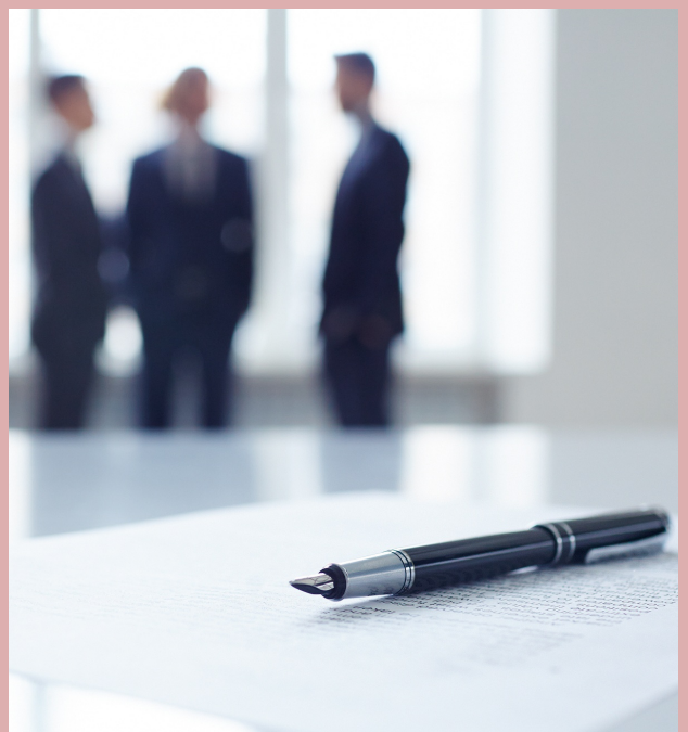
อ้างอิงจากหนังสือสำนักทะเบียนกลาง ที่ นก 0309.6/ว 19201 ลงวันที่ 11 สิงหาคม 2564

แนวทางการแก้ไขปัญหา กรณีนี้จะต้องบันทึกการจำหน่ายรายการ ยกเลิก หรือเพิกถอนทั้งในหลักฐานเอกสารและบันทึกในฐานข้อมูลการทะเบียน พร้อมทั้ง SCAN เอกสารจัดเก็บในระบบฐานข้อมูลด้วยทุกครั้ง สำหรับคำขอมิบัตรฯ (บ.ป. 1) ใบแจ้งการย้ายที่อยู่ทะเบียนคนเกิด ทะเบียนคนตาย ฯลฯ ที่ไม่ได้ออกด้วยระบบคอมพิวเตอร์ แต่มีการจัดเก็บไว้ในฐานข้อมูลการทะเบียนหรือระบบภาพถ่ายไมโครฟิล์มให้แจ้งให้สำนักบริหารการทะเบียนบันทึกให้