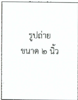
รูปถ่ายเจ้าของประวัติ