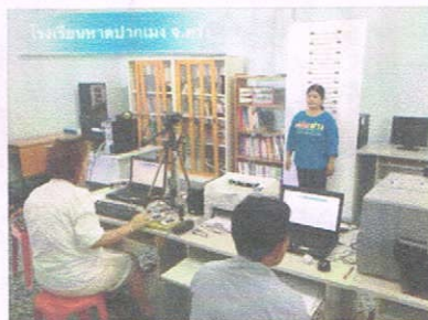
โรงเรียนหาดปากเมง จ.ตรัง