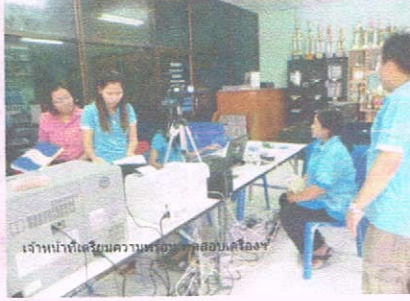
เจ้าหน้าที่เตรียมความพร้อมก่อนปฏิบัติงาน