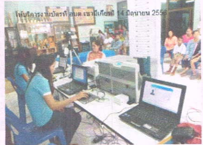
ให้บริการประชาชนที่ อบต. เขามิเกียรติ 14 มิถุนายน 2556

ศูนย์บริหารการทะเบียนภาค 9 สาขาจังหวัดสตูล และอำเภอเมืองสตูล ได้เข้าร่วมกิจกรรม โครงการจังหวัดเคลื่อนที่ ณ โรงเรียนบ้านเกตรี เมื่อวันที่ 23 พฤษภาคม 2556 ทั้งนี้ นายอำเภอเมืองสตูล (นายรัฐพนธ์ ณ อุบล) ได้ให้เกียรติตรวจเยี่ยมชุดปฏิบัติงานในวันดังกล่าว