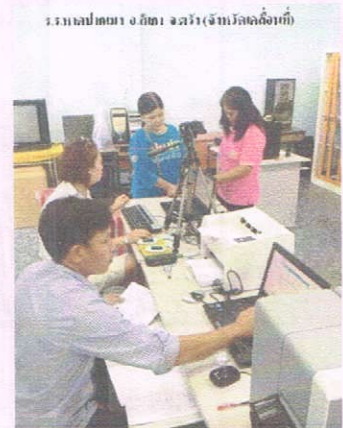
ร.ร.หาดปากเมง อ.สิเกา จ.ตรัง (จังหวัดเคลื่อนที่)