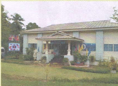
ประมวลภาพ : โครงการคัดเลือกศูนย์บริหารการทะเบียนภาค 9 สาขาจังหวัดตรัง

ทั้งนี้ ในส่วนของศูนย์บริหารการทะเบียนภาค 9 ได้นำเสนอผลงานของศูนย์บริหารการทะเบียนภาค 9 สาขาจังหวัด ตรัง อ.ห้วยยอด จ.ตรัง ซึ่งคณะกรรมการฯ ได้ตรวจประเมินเมื่อวันที่ 2 สิงหาคม 2556 โดยมี หัวหน้าศูนย์บริหารการทะเบียนภาค 9 และคณะฯ ให้การต้อนรับและนำเสนอข้อมูลผลงานในวันดังกล่าว