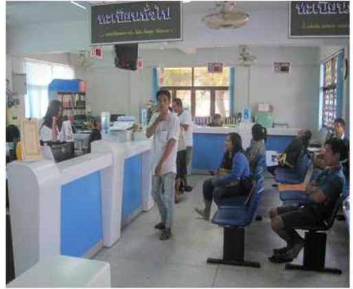
สำนักทะเบียน อ.โพนทราย