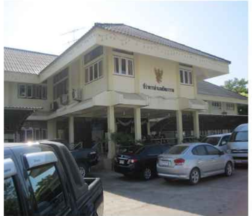
ที่ว่าการ อ.โพธาราม