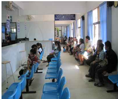
สำนักทะเบียน อ.สวนผึ้ง