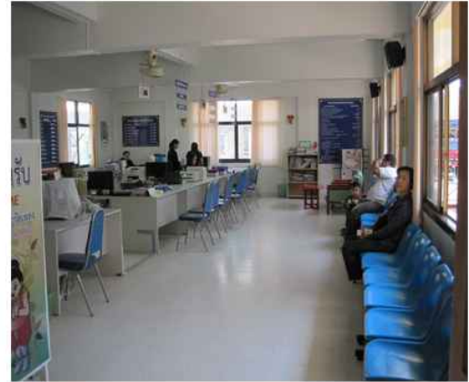
สำนักทะเบียน อ.วัดเพลง