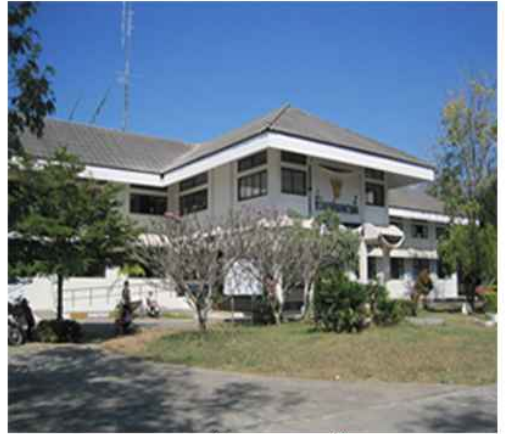
ที่ว่าการ อ.สวนผึ้ง