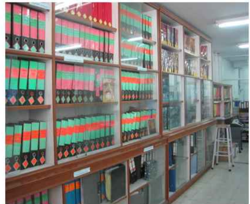
สำนักทะเบียนท้องถิ่นเทศบาลเมืองโพธาราม