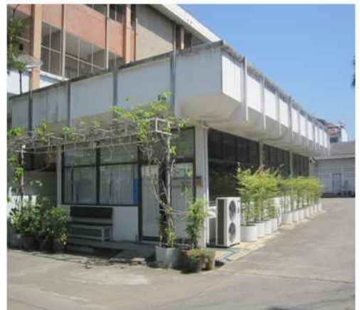
เทศบาลเมืองโพธาราม