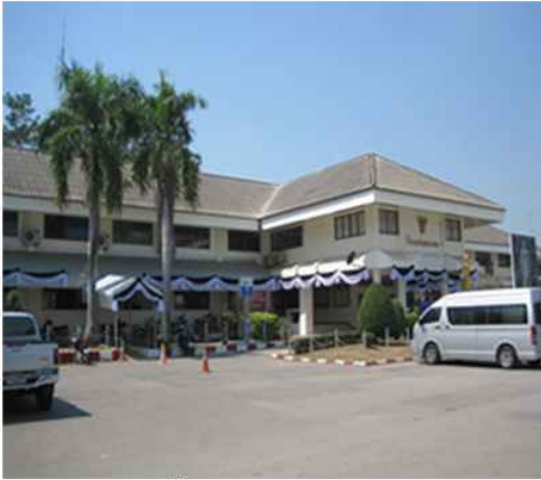
ที่ว่าการ อ.บางแพะ