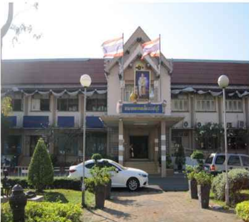
เทศบาลเมืองราชบุรี