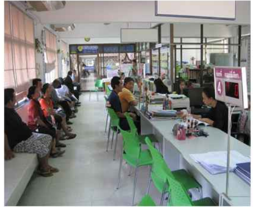
สำนักทะเบียน อ.บางแพ