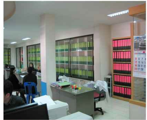
สำนักทะเบียนท้องถิ่นเทศบาลเมืองราชบุรี