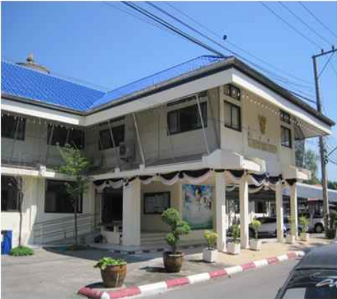
ที่ว่าการ อ.วัดเพลง